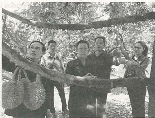
ทุเรียนที่มีคุณภาพขึ้นอยู่กับเกษตรกรที่จะต้องให้การดูแลระบบการจัดการสวน ซึ่งเป็น

รองอธิบดีกรมส่งเสริมการเกษตร เปิดเผยเพิ่มเติมด้วยว่าที่ผ่านมาทางสำนักงานเกษตรจังหวัดและหน่วยงานที่เกี่ยวข้อง เช่น กรมวิชาการเกษตรได้ร่วมกันผลักดันให้เกษตรกรทำการผลิตสินค้าซึ่งเป็นสินค้า GAP เป็นตัว