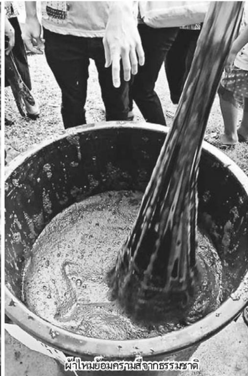
ผ้าไหมย้อมครามสีจากธรรมชาติ